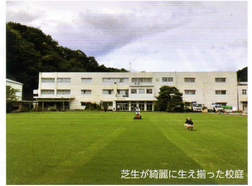
芝生が綺麗に生え揃った校庭

緑一面のグラウンドは「スマイルポート」の愛称で地域の人たちが集う場として活用されています。今後も芝生管理を行い、ヘリポートとしての充実や八岳地区の交流の場として充実を図っていきます。