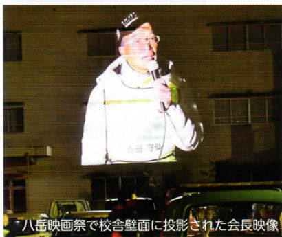
八岳映画祭で校舎壁面に投影された会長映像